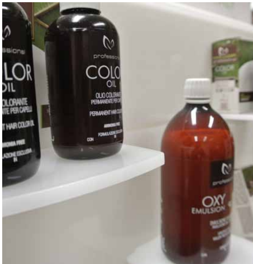
Esposizione di prodotti di Major Group

La Calabria può contare su molti imprenditori di prima generazione, quelli che si sono fatti da sé; ma a volte questi s'improvvisano, affrontano insuccessi e sono poi costretti a chiudere. Invece, quelli che riescono ad avere successo se ne vanno. Le imprese di seconda generazione, quelle che hanno interiorizzato e fatto propria la cultura imprenditoriale potrebbero essere il vero motore di questa regione.