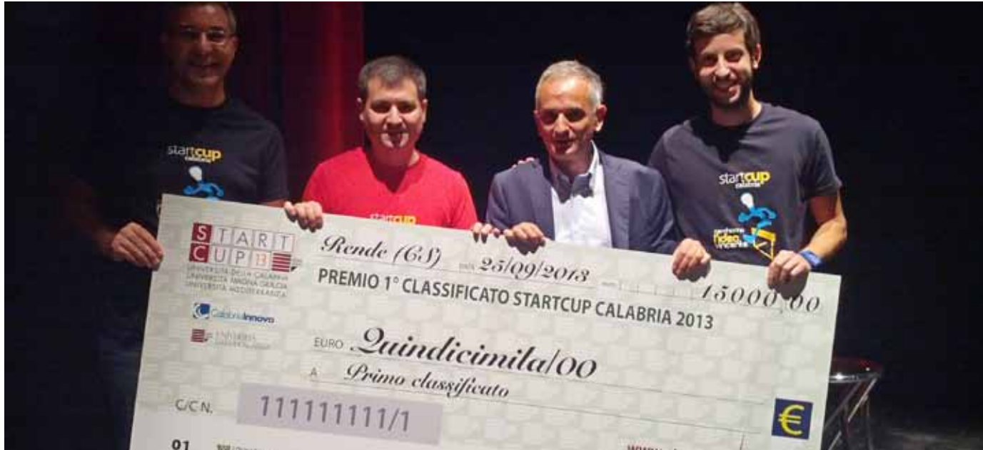
Il Team di Scalable Data Analytics alla Start Cup 2013

Lo dicono tutti, a partire da prestigiosi Istituti come il MIT (Massachusetts Institute of Technology) che proprio in questi giorni lancia un nuovo corso di formazione sul tema, ai blog che interpretano le nuove tendenze tecnologiche come Chefuturo!. Wired lo definisce addirittura il settore, e il mestiere, più sexy del futuro: la parola chiave del 2014 sarà Big Data.