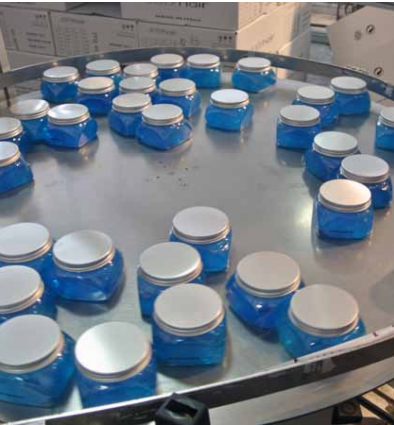
Una fase della produzione dei cosmetici

della persona. E le realtà piccole come la Major possono sopravvivere alle multinazionali solo grazie a un investimento costante in ricerca e innovazione che punti alla qualità dei risultati. Chi viene da noi, infatti, cerca prodotti di qualità.