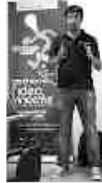
Un momento della Start Cup

però, solo 21 parteciperanno alla fase successiva, la TechWeek, una settimana di mentorship imprenditoriale dedicata alla costruzione del business plan e alla definizione delle strategie di mercato, in programma dal 2 al 6 settembre prossimo».